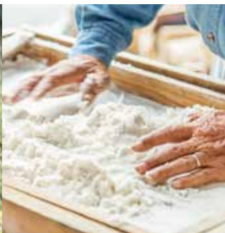
固まりがなくなり、サラサラの白く光る塩が出現。この瞬間が感動的