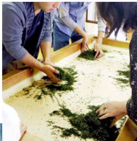
茶葉を一本一本まっすぐにねじるように手で揉んでいく