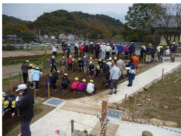
本陣跡広場北側の畑で「藤川まちづくり協議会」の指導のもと、地元の小学生がむらさき麦の種を播いている。