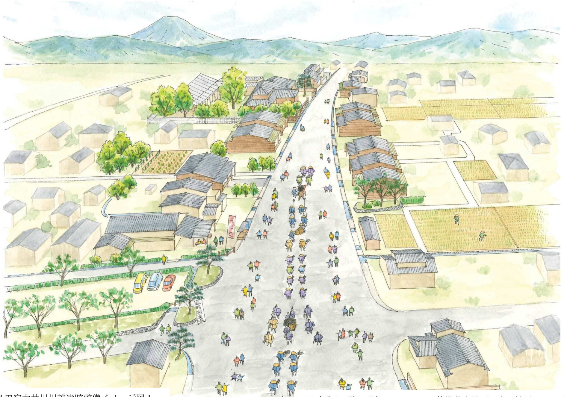
島田宿大井川川越遺跡整備イメージ図1