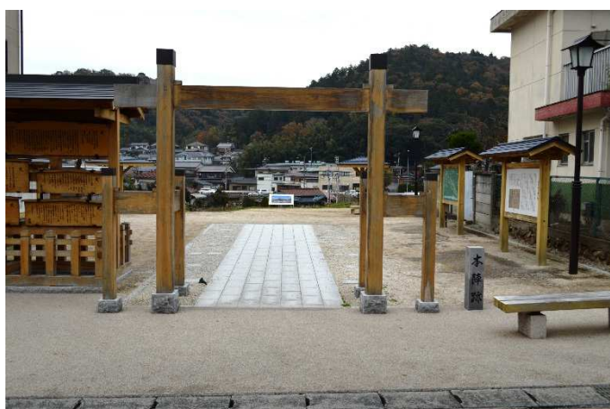
藤川宿本陣跡広場