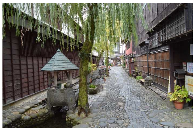
やなか水のこみち