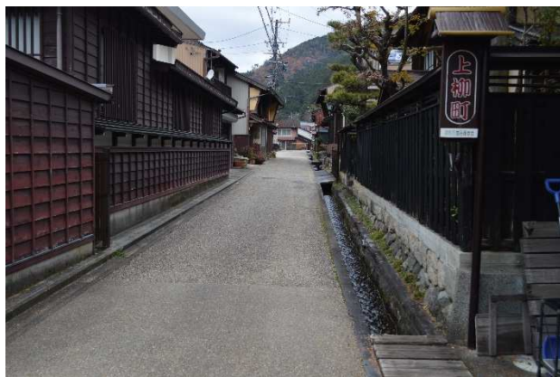
郡上八幡北町伝統的建造物群保存地区