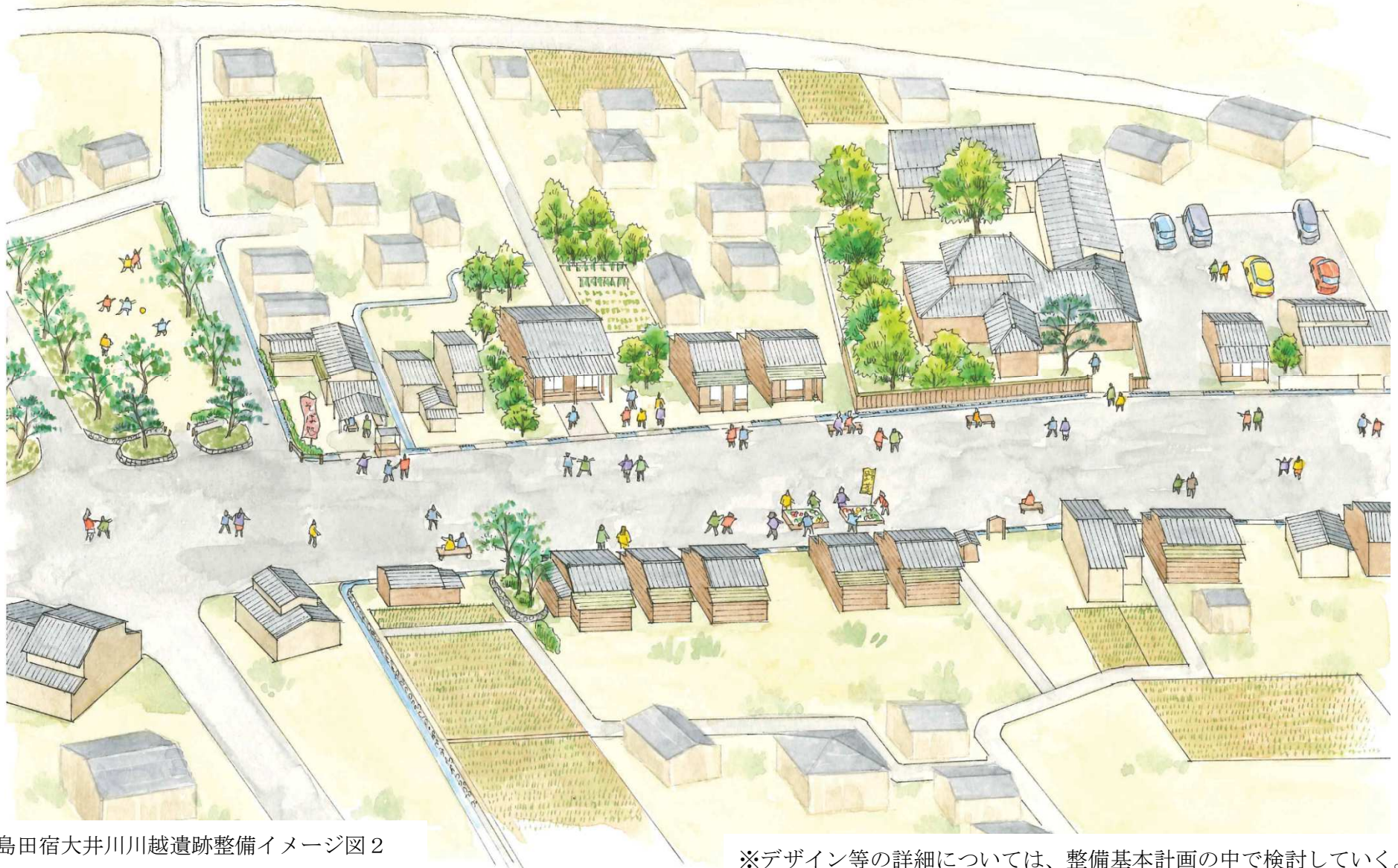
島田宿大井川川越遺跡整備イメージ図2