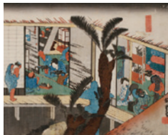
歌川広重 《東海道五拾三次之内赤坂旅舎招婦ノ圖》部分 江戸時代

江戸時代、旅の思い出を綴った筆記用具を入れていた矢立の数々、当時の旅行ガイドブックともいえる道中記や浮世絵などから旅文化を紹介します。