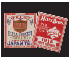
茶箱ラベル(輸出用) 明治時代後

蘭字は輸出用の茶箱ラベルです。日本の伝統と西洋文化を融合させたデザインが多く見られました。蘭字や茶箱を通じて明治の茶文化の一側面を紹介します。