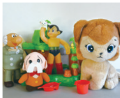
昭和の玩具 昭和中期～後期

昭和から平成にかけて親しまれたおもちゃや遊び道具を紹介します。当時の子供達が夢中になった遊び道具の魅力、各世代の視点からお楽しみください。