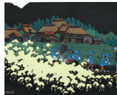
海野光弘 《選春の鬼無里》部分 1974年

柔らかな桜、可憐なつゆ草、爽やかな水芭蕉…。香りや日差し、吹き抜ける風、そして揺れる花びらの微かな音も感じる作品をどうぞご覧ください。