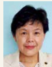
おおせ ききぬ よ 大関衣世