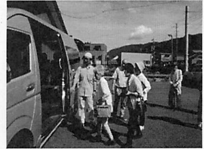
買い物ルートに乗車する利用者