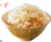
割烹 三三九/磯藤 特定非営利活動法人こころ・りなむ

古来より島田市で親しまれてきたさくらめしを使ったお弁当を販売。旅人気分で味わってみては？