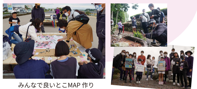
みんなで良いところMAP作り