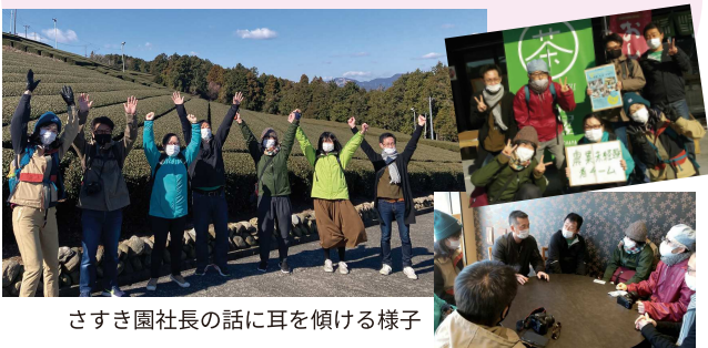
さすき園社長の話に耳を傾ける様子