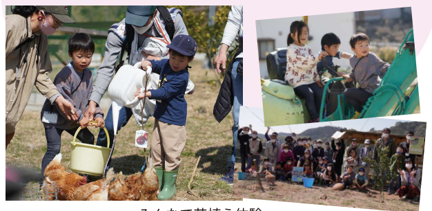
みんなで苗植え体験