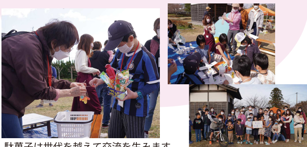
駄菓子は世代を越えて交流を生みます