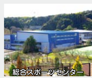
総合スポーツセンター

市債については、公的資金補償金免除線上償還の制度を活用し、平成19年度から21年度の3年間に、計画どおり年利5%以上の高金利借入金19億7582万円の線上償還を行いました。