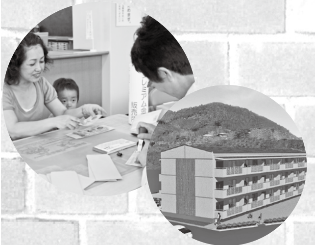
子育て世代型住宅・川根 (平成 23 年 3 月完成予定)