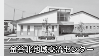
金谷北地域交流センター