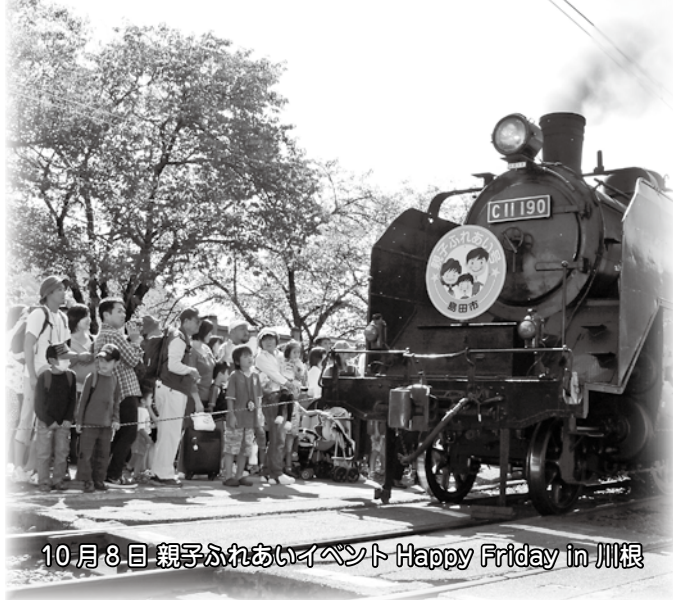
10月8日 親子ふれあいイベント Happy Friday in 川根