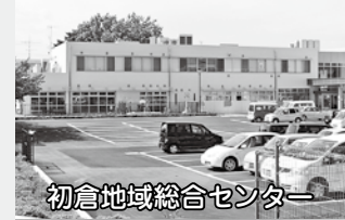
初倉地域総合センター