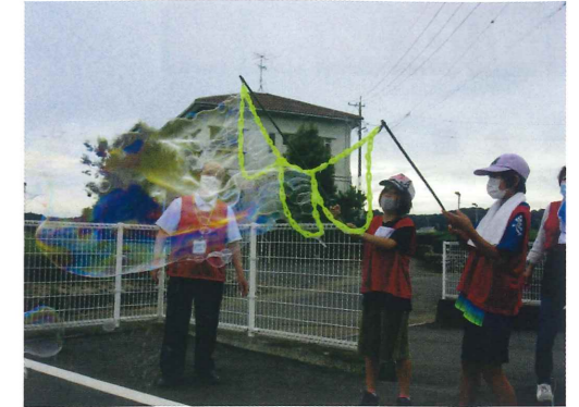
『初倉放課後子供教室（シャボン玉 と・ば・そ）』