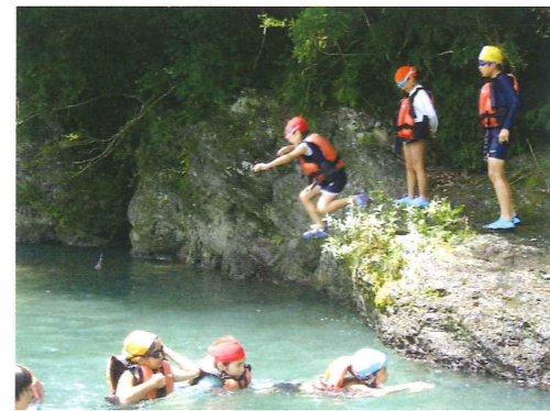
『サマーオープンスクールの様子』