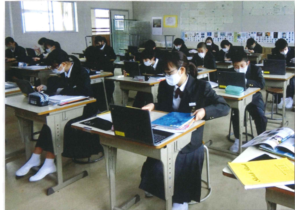
教育総務課 『1人1台端末を活用した授業風景』