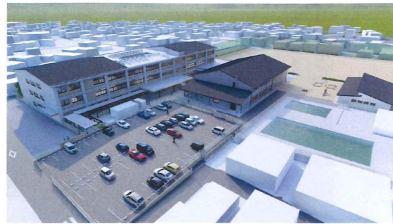
『島田第一小学校 パース図』