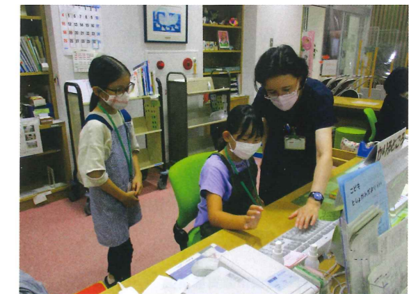
『夏休み小学生一日体験図書館員（島田図書館）』