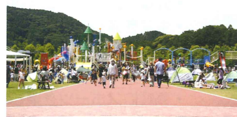
『島田ゆめ・みらいパーク』