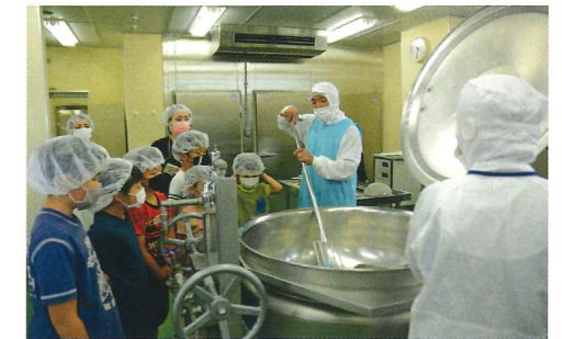
『夏休み親子施設見学会』