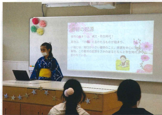
『島田第四小学校 電子黒板を使って説明する児童』