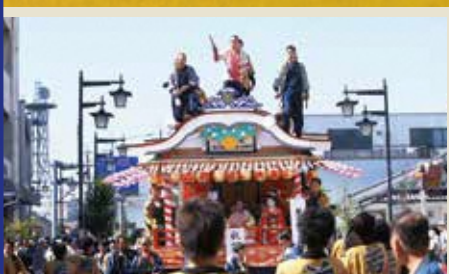
舞台踊りを「上踊り」、地上踊りを「地踊り」と呼びます。東西一流の長唄の芸人衆が島田に呼び寄せ、5台の屋台が三日三晩芸を競い合います。