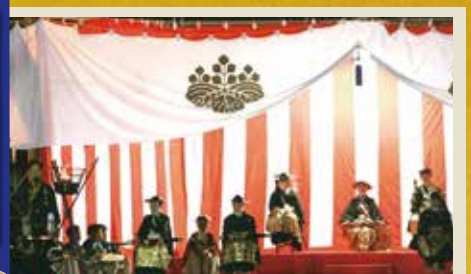
暗闇の中、スポットライトに浮かび上がる本陣。提灯が一行に並び、篝火が焚かれます。お供を従えたお殿様が本陣へ入場します。

東海道の宿場町として栄えた静岡県島田市。元禄8年に始まって以来、本年度第二〇回目を迎えます。その昔、島田に嫁いできた花嫁は、晴れ着姿で大井神社へお参りし、その姿で町を歩き披露するのが習わしとされてきました。それは気の毒ではないかと花嫁を気遣う心から、女の命「帯」を大奴が木太刀に飾り、安産祈願とあわせて、人々への披露を行うことになりました。そうなる親たちは嫁入り道具の中でも特に気を配るようになり、娘を気づかい、はるばる親が来る。逸品を見ようと商人が来る。さながら帯のファッションショーとなったのが帯まつりの始まりです。