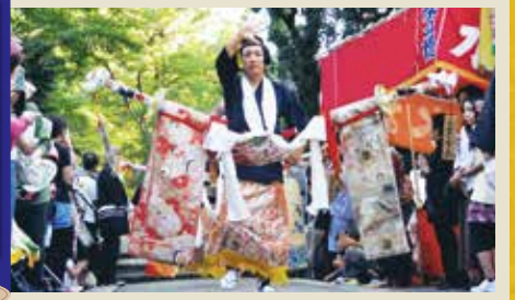
大奴は神輿渡御の警護役で、大名行列の花形です。25人の大奴は左右に一問(約1.8m)近い木太刀を突き出し、その柄に見事な丸帯を掛けます。