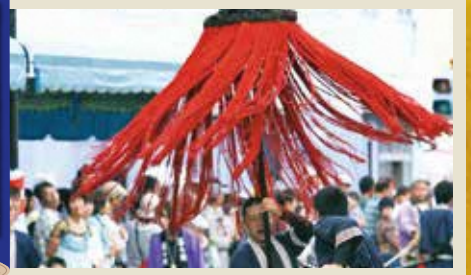
大鳥毛は赤い房と頭の部分があり、上部を「矛(ほこ)」と呼んでいます。天空の悪鬼を倒し世に平和をもたらすものといわれています。