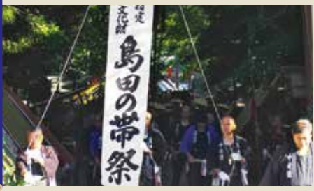
お長柄を先頭に、具足、先騎、鉄砲隊、御弓、具足と続き、次が25人の大奴。腰の木太刀には豪華な帯が飾られています。