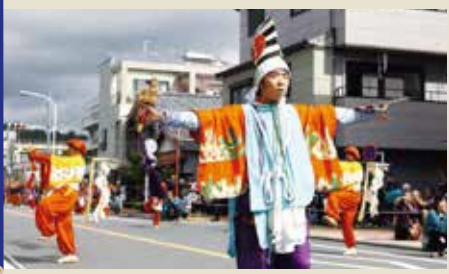
延宝年間のこと、疫病が蔓延したため、大井神社の境内に春日神社の神霊を奉じ疫病退散を祈願しました。これが鹿島踊りの起源です。