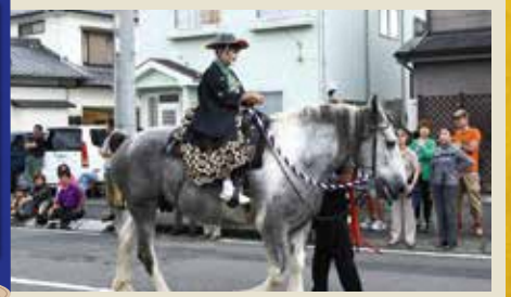
しぶい声で見事な節まわしの歌が歌われる中、大勢のお供にかしずかれた、かわいいお殿様が馬に揺られて行きます。