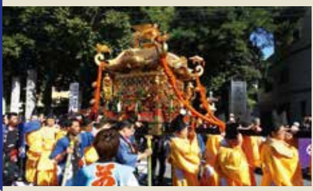
女神様の神輿を担ぐ若者は16人。重さはなんと約400kg。大井神社をスタートし、お旅所へと静かに歩きます。