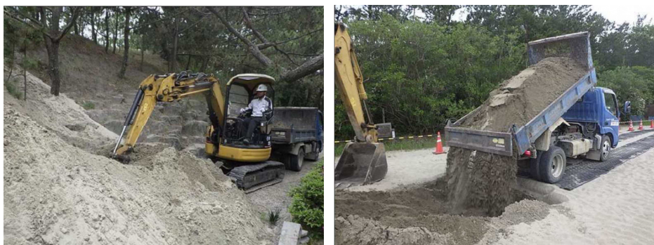
図2 掘削作業（左）及び埋め戻し作業（右）の様子