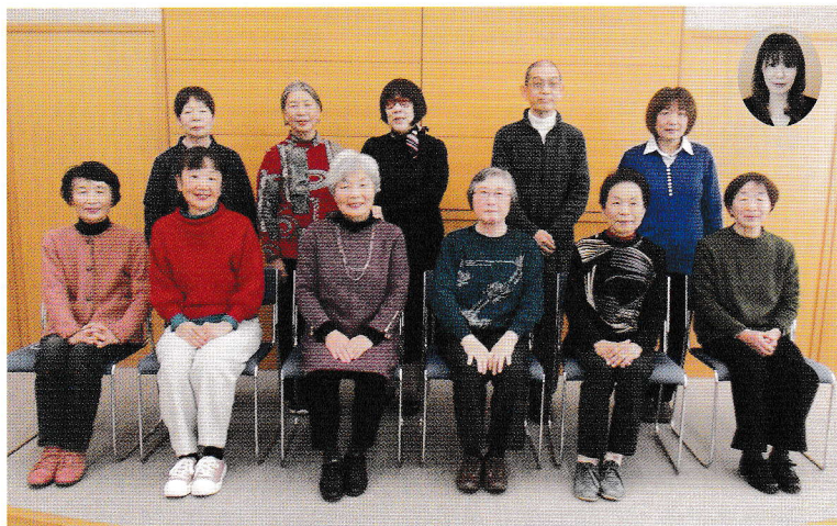
【介護相談員 集合写真】

新型コロナウイルス感染拡大防止のため、令和3年度も昨年度に引き続き、以前のように多くの事業所を訪問することができませんでしたが、今後、どの程度活動ができるのか不透明ですが、感染状況をみながら派遣事業を行ってまいりますので、今後ともご理解とご協力をお願いいたします。