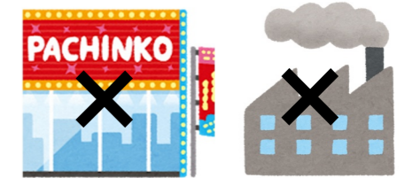
立地の制限を行う建物のイメージ

都市計画法に基づき定められた地域地区の一つで、用途地域が指定されていない区域において、その良好な環境の形成または保持のため、地域の特性に応じて、合理的な土地利用が行われるよう、特定の建築物や工場の用途に対する制限を定めるものです。