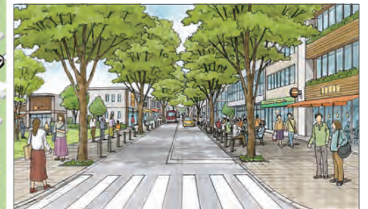
④市民や来訪者が集い楽しめる空間づくりのイメージ(本通り周辺)