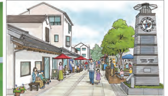
②市民の交流やにぎわい創出のイメージ(おび通り)