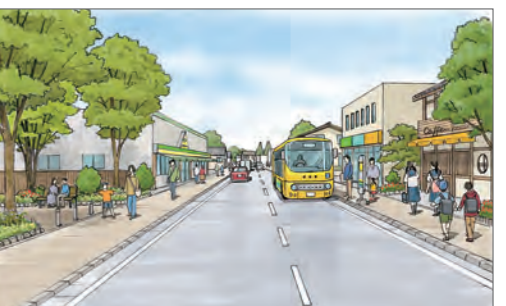
⑥幹線道路の整備イメージ(六合地域)