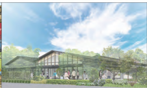
⑩KADODE OIIGAWAによるにぎわいの創出イメージ