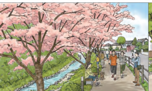
⑦湯日川沿いの遊歩道のイメージ