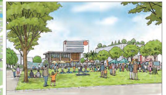
③市民や来訪者が集い楽しめる空間づくりのイメージ(島田駅前空間)