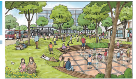
①市民の交流やにぎわい創出のイメージ(市役所周辺)