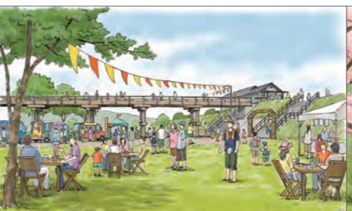
⑧歴史資源周辺の活用のイメージ(蓬菜橋)