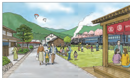
⑪家山駅周辺の魅力向上のイメージ