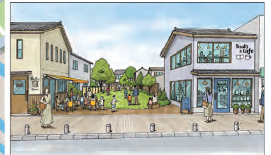
⑤まちなかの低・未利用地の活用のイメージ(本通り)