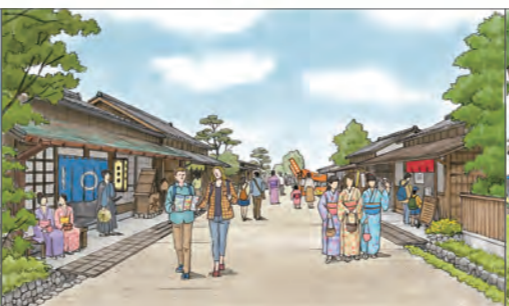
⑨歴史資源周辺の活用のイメージ(川越街道)