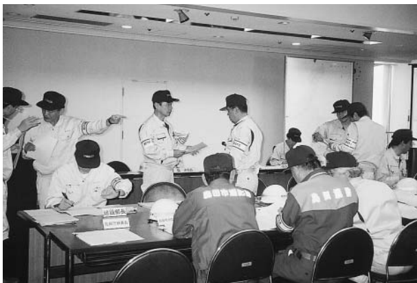
9月1日に行われた防災訓練（災害対策本部）

答 要援護者対策では名簿の作成がまず問題になる。高齢者については、ケアマネージャーが聞き取り調査したものを本人の同意を得て市が把握しているものがある。障がい者については、特に重度の方について地図上に示す準備を進めているが、障がい者台帳を流用することになるので、10月の個人情報保護審議会に諮る予定である。災害時の要援護者情報の提供については生命財産を守る目的で認められているが、平常時においては審議会での審査とともに最終的には本人の了承が必要と考える。要援護者台帳の作成は現在自主防災組織が行っているが、要援護者の安全確保のために重要であることから、今後は自主防・民生委員・行政が協議して整備に取り組みでいきたい。また、避難場所については、要援護者は一時避難場所からさらに安全な場所に移ってもらう必要があることから、市内の関連施設と協定を結んで必要量の確保に努めているが、まだ不十分な面があるので今後も拡充を図りたい。