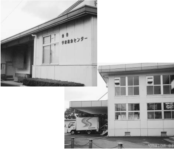
民間委託が計画されている 金谷学校給食センター(左)、南部共同調理場(右)

答 既設の学校法人にやらせるのが一番早いのが、地元で手を挙げた以上地元が大事だ。平成18年4月を民営化の目標にしたが、いろいろの事情があったって平成19年4月になったということだ。