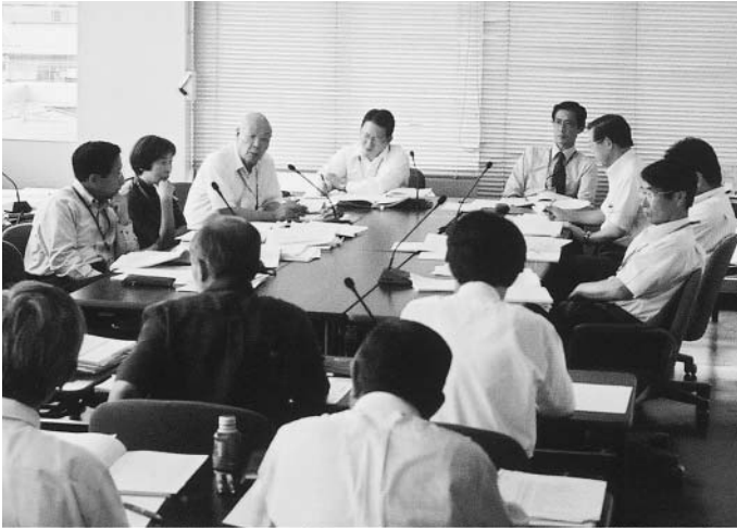
総務教育常任委員会での審査

答 公的年金収入金額が240万円のひとり暮らしの場合、18年度年額1万4700円、19年度は年額2万9400円の課税となる。