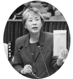
つだ けいこ 津田恵子 議員