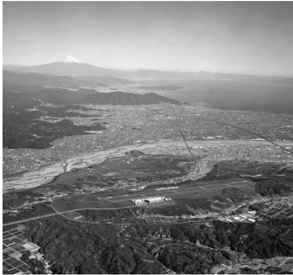
静岡空港完成予想写真（開港予定平成21年）

答 県は、現在調査など、土地収用法に基づく手続きを進めており、調査完成後早い時期に収用委員会に採決申請をする予定、審理期間は現時点では不明だが、すべての手続きの終了は事業認定告知から2年ほどかかり、工事については、収用地は手続完了後となるがそれ以外は計画に従って実施され、工事完了は平成20年11月1日としている。その後試験飛行などを行った後、開港は平成21年春と聞いている。