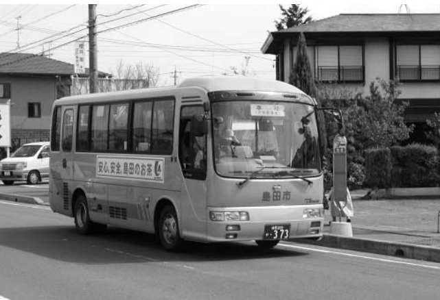
路線延長などが検討されるコミュニティバス（湯日線）

問 ①今後のバス路線の拡充計画②湯日線の昼の時間帯も一時間毎の運行に。また金谷駅までの路線延長を考えてほしい。③路線の充実や増加を考えると財政の問題が出てくると思うが現在の料金を維持していくのか。 答 ①利用状況、財政状況などを考慮し全体として利便性の高い運行を実現したい。②利用の低い昼の時間帯を2時間1運行とした。路線の延長に