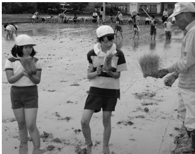
地域の人との田植え体験

答 昨年度より学校給食地産地消推進連絡会を組織し、農業生産者グループや関係団体の協力を得て、地場産物の新たな品目の洗い出しや学校給食への導入方法を協議している。地元農家と協力し地産地消を進めたい。また、給食の時間に農業や食材の話をししながら、子どもたちと食してもらいなど検討していく。