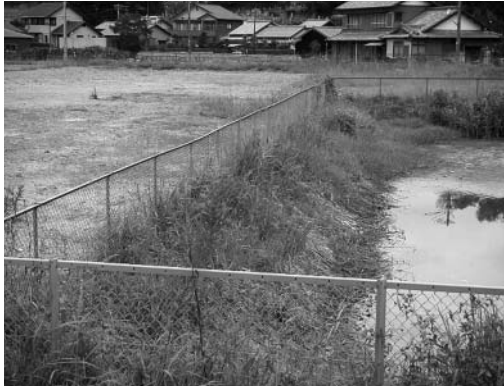
民間保育園とあさひ学園の建設予定地（落合）

※その他、資源化促進のため、家庭のてんぷら廃油や古布も分別収集を行うよう提案した。