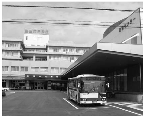
島田市民病院と救急センター

答 合併により行政区域が広がり、人口も10万人規模となったことから助役の設置を検討しており、来春には適格な人材を国