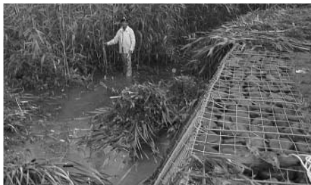
布団籠護岸と河床内「葦」の刈り取り作業

答 地域間格差の基準はないが、指摘による状況を提示し、警察官の増員を要望するとか、負担率を勘案し格差是正に努め地域での防犯組織の補助事業を行なう。