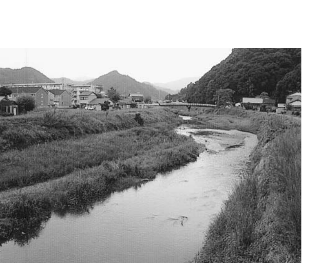
生活雑排水で水環境が心配な河川

問 汚水処理施設の整備で、市町村設置型の合併処理浄化槽整備事業は、個人の負担も軽く、5人槽で8万9千円、使用料が月3700円で、迅速に整備できるメリットがある。環境面、経費、効率的な汚水処理という意味から、市町村設置型の合併浄化槽の整備を推進すべきと考えるがどうか。