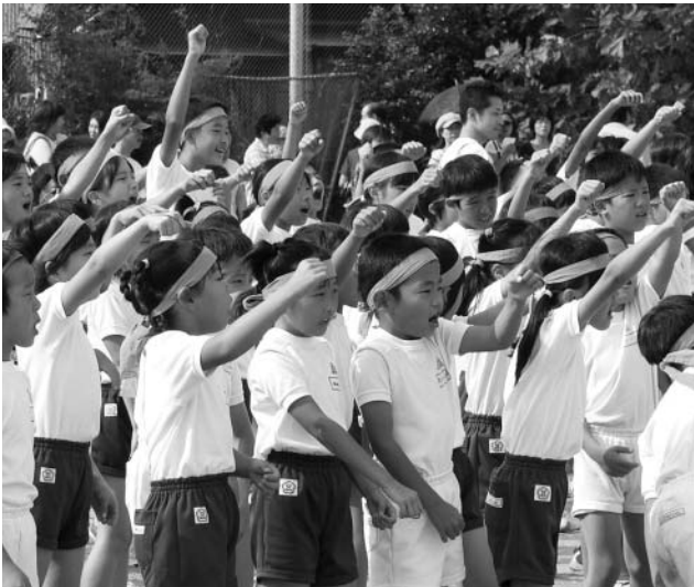
次世代の子どもが豊かな心をはぐくむために