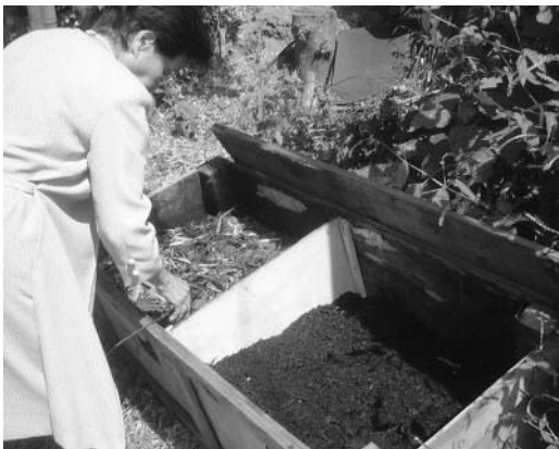
せんていし 剪定枝の堆肥を利用する生ゴミ処理方法

答 ①環境基本計画で望ましい環境像として4Rを示した。市民、事業者、市が一体となってゴミになるものを売らない、買わない、不用品の再利用、再生利用に取り組み、廃棄物の発生を抑制するとともに、ゴミに対する関心を高め、ゴミ減量の展開を目指すものである。 ②ゴミ減量や生ゴミ処理については市民グループと話し合っていきたい。 ③阿知ヶ谷の焼却場は解体すればかえってダイオキシンが飛散して危険である。煙突の上へふたをするか、工事費がかからない程度に、煙突だけ解体して、あとは再利用するか。解体すると相当なダイオキシンが入ってくることは間違いないから、解体するだけで数十億円かかる。国の補助金は幾ら出るかわからない。だったら、置いておく。解体にお金をかけるのなら、福祉の方へ予算を回した方がいいと思う。 ※この他にアスベスト問題と国民保護法について質問しました。