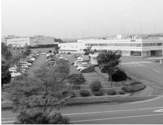
エコポリス工業団地 (掛川市)

いと将来財政が大変なことになると考えられる。掛川市では企業や工場が多くあり、またエコポリス工業団地、新エコポリス工業団地などもあることから税収が豊かであり市の経済も活況を見せている。そこで島田市も静岡空港、東名、第二東名、