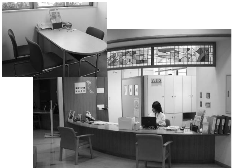
保健健康センター「はなみずき」総合窓口と相談場所

気を付けてやっていかないと心身に与える影響は大きいと思われる。福祉施設の管理者として、一括してその施設全体を管理するという指定管理者を導入する形が望ましいと考える。事業計画の内容を精査し、実際に行われる介護サービスについても適切なものかどうかチェックをして選考していきたい。