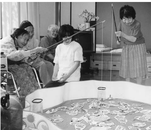
機能訓練を兼ねたレクリエーション（北部デイサービスセンター）

答 現在、島田市北部デイサービスセンターと、島田市伊久身デイサービスセンターは、島田市社会福祉協議会へ管理の委託をしている。地方自治法が改正され、公の施設の管理は、指定管理者か直営の、2つの選択肢となった。直営にした場合、経費の増が見込まれることから、指定管理者制度を導入することにした。