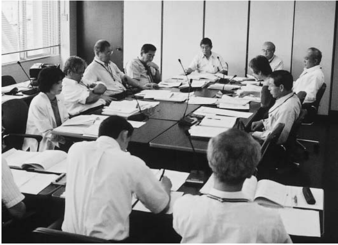
経済建設常任委員会での審査

答 産業祭、ばらの丘フェスタ、市町村駅伝、販売戦略シンポジウム、農閑期茶業講座などを計画しているが、今回の増額補正については、合併に伴い一層の茶業の振興を図ることを目的として増額を行うもので、それぞれの組織の全体の事業に対する助成ということであり、議決前執行ではないと考えている。