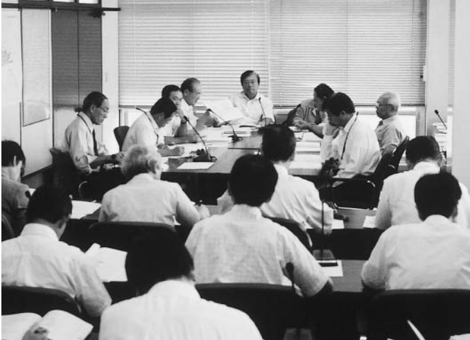
民生病院常任委員会審査の様子