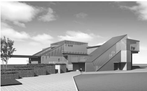
JR島田駅南口の完成イメージ

問 この事業は周辺住民の長年にわたっての強い要望とさらに、市街地活性化と静岡空港アクセスの拠点として市の最優先プロジェクトと位置づけられ平成20年度末の事業完了を目指している。そこで①南北駅前広場の整備、②駅南地域の拠点施設、③駅南整備について伺う。 答 ①停車スペースや身体障がい者用の乗降スペースを新たに設置。南口