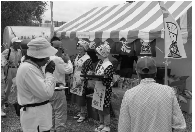
島田のお茶を全国にアピール！（全国グラウンドゴルフ交歓大会）