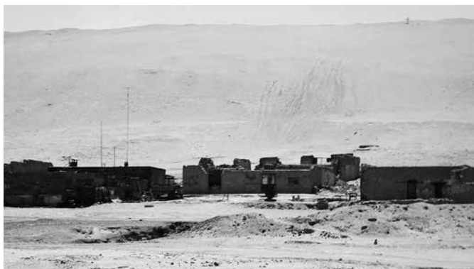
山の開発で井戸が濁水し廃村となったチリ・アグアベルデ村(青々と深く、澄んだ水の意)2008年。大井川を縄文人の言葉で訳すと「深い」という意味になる。

の首長と連携して対処することを強く要望する。 答 JR側から当市に説明がないが、JR側には意見書を提出した。 問 市内の食料自給率は。 答 現在12%、目標17%。 問 家庭菜園や、種をつける在来品種の野菜を推進するつもりはないか。 答 家庭菜園は徐々に進める。在来種は模索する。 提言 食料自給率アップは農家だけでなく家庭にも協力を仰ぐ時代。家庭菜園は家族関係の改善、地域との接点にもなり、しっかりと種をつける作物は、命をつなぐ真の食育になる。考えてほしい。