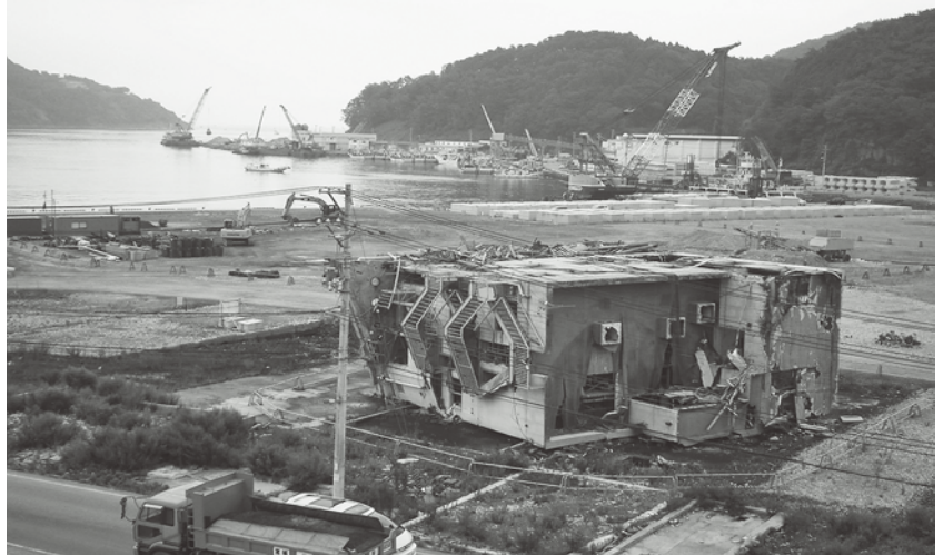
危機管理対策の強化のため危機管理部の設置 写真は復興整備が進む宮城県女川町(平成25年8月)

化により、市民の利便性の向上を目指している。また、平成27年度からスタートする子ども子育て支援制度の準備を円滑に実施するためである。なお、幼稚園児の教育指導や教育相談は、引き続き教育委員会の所管とする。