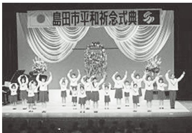
「平和都市宣言」制定へ（昨年の平和祈念式典の様子）

問 県内他市の平和都市宣言の制定の状況は。 答 現在、宣言を行っていないのは、島田市と御前崎市の2市である。牧之原市は平成22年に市民を含む何人か