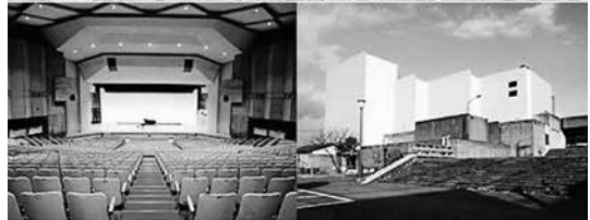
市民病院・市民会館

市の支援員が2人いる。 問 市民病院、市民会館の今後について、市長の思いを問う。 答 病院については志太、榛原で4カ所は多いと思うが今の病院の寿命を考えると市で建設するべきである。広域での再配置は次のステップと考える。市民会館は耐震補強ができるか否かの結果で判断する。施設の在り方は今後広域で考える時代になってきていると考える。