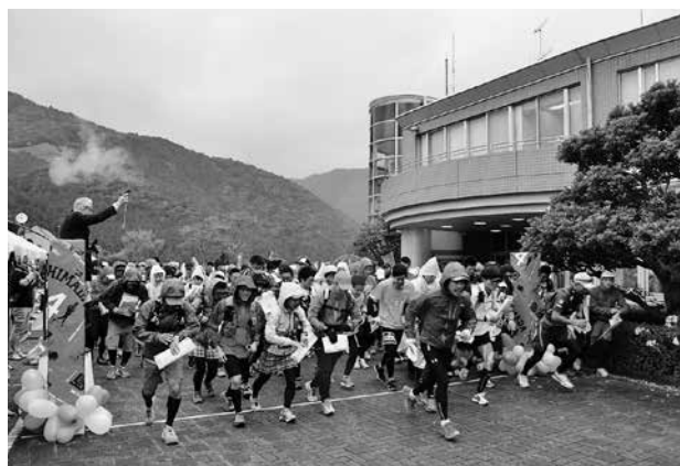
地図をもとにチェックポイントを回り得点を集める フォトリゲイニングのスタート