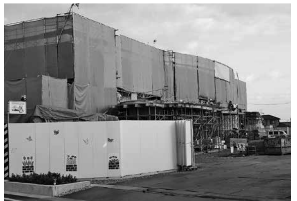
待機児童削減の期待の掛かる、建設中の『みどりこども園』

問 避難所は地震災害時を想定しているようだが、水害時の避難所として十分機能を発揮するのか。 答 避難所の敷地が周辺の河川より低い、高さが十分でない避難所は確かに幾つかある。しかし、ここ10年来、水に浸かったということはない。万が一、床上浸水の恐れがある時には、基本的に垂直避難という形で施設の2階以上の場所に移動してもらう。 問 10年来、浸水はないということだが、ここ2・3年記録的な豪雨と言われているものが多発している。10年ないかもしれないが、可能性があるのに、次の避難所を想定しておく必要があると思う。 答 1階が床上・床下浸水になった場合、その上に避難することは落ち着かないのではないかと思う。浸水の可能性がない地区に避難できるように対策を考えていただきたい。 問 10年来、浸水はないということだが、ここ2・3年記録的な豪雨と言われているものが多発している。10年ないかもしれないが、可能性があるのに、次の避難所を想定しておく必要があると思う。 答 第一次避難所が使用できない場合は、第二次避難所を順次開設していく。