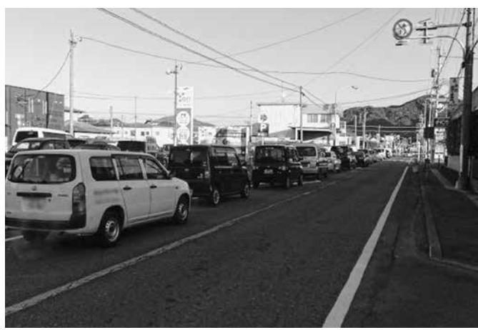
渋滞が激しい朝の御仮屋踏切南側付近

機が下りている時間が非常に長くなっている。その間を通る幹線が島田大橋や谷口橋といった大井川架橋につながっているため、大きな渋滞を引き起こしているのではないかと考えられる。これが島田市が他市と比べてインフラ整備で遅れているという印象を与える要因になっている。これについて、取り組み考えはあるか。