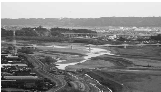
湧水が懸念される大井川

問 市内における地下水くみ上げ量は幾らか。 答 平成24年度の採取量は日量の9万1494立方メートル。 問 地下水の賦存量は把握しているか。 答 市は把握していないが、来年度県が調査予定である。 問 地下水に関する市民からの