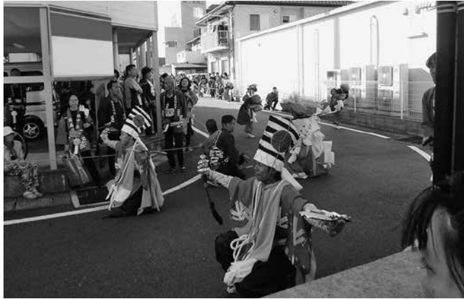
今回の大祭・鹿島踊り（新町通り付近にて）

部分は行政や観光協会が行うといった車の両輪のような形でこれまでも運営してきた。祭り本体を運営する内部からは、議員指摘の趣旨と同じような発言が出てきており、改