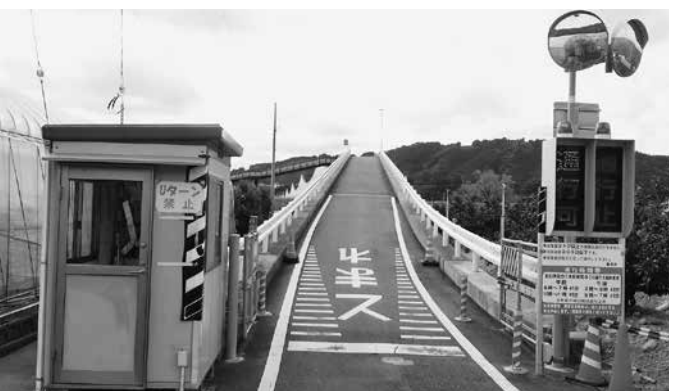
水路橋登り口（神座側より）

問 交付税に頼っているといざという時に影響が出る。自主財源で賄うという考えはないか。 答 本来はそうあるべきだが現状では難しい。