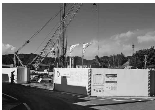
JVによる調理場建設工事

にしないと代理店が有利になり競争にならない。入札方法を検討すべきだ。 学力向上の取り組みは 問 全国学力テストでの静岡県小学6年国語Aの平均正答率は、全国ワーストワンだった。県知事の発言を受けての見解は。 答 公表は、学校比較の恐れがあり、避ける必要があったと考える。