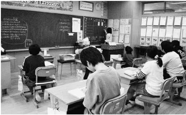
重要な特別支援体制

問 スクールソーシャルワーカーの配置はあるか。 答 市の予算で2人配置している。 問 学習支援講師の配置は行っているか。 答 行っていないが、9人の学習指導支援員が学習補助を行っている。