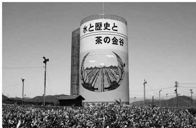
大井上水道企業団牧之原配水池(平成15年度築造)

ている。あるが、利用者に理解を求めている。また、効率的経営、施設の維持管理、人件費の削減という意味では、当然その方向にあることは間違いない。大井上水道企業団の議会の中で、共通の認識を芽生えさせることや、統合は住民のためでもある、といった土壌づくりを最初に行うべきだと思っ