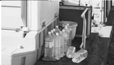
水道を心待ちにしている利用者（南町多目的広場）

問 水道は、あつた方がよいと思う。また、地元からの要望も聞いている。設置しないとは言っていないが、時期や工法を検討している。 答 水道は、あつた方がよいと思う。また、地元からの要望も聞いている。設置しないとは言っていないが、時期や工法を検討している。