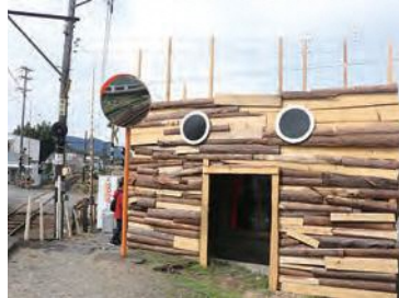
Me and My Monster (私とわたしの怪物) / してかずおとまち (代官町駅、福用駅)