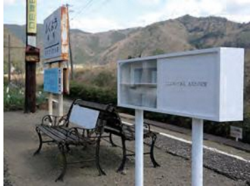
無人駅文庫 / 木村健世 (福用駅)