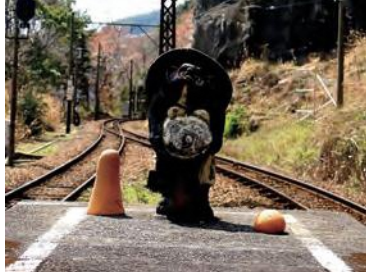
地藏まえ / さとुरさ (神尾駅)

2019年3月8日(金) — 24日(日) / 17日間 大井川鉄道無人駅周辺 (静岡県島田市・川根本町)