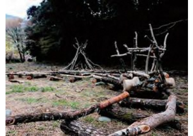
森のコースター2 / 夏池藤 (川根温泉笹間渡駅)